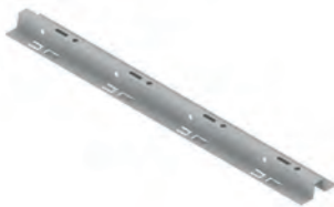
Perfil de suspensión 00PG