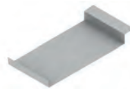
Pieza de unión para lama H190